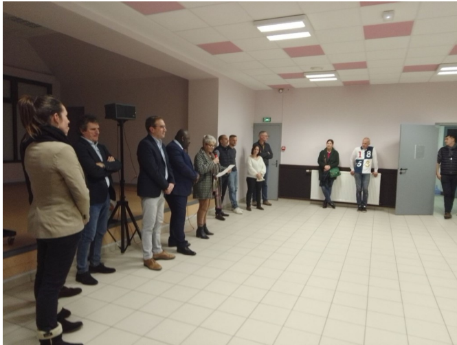
La cérémonie des vœux du Maire